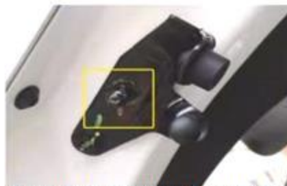
Замените болт с шаровой головкой на правом кронштейне задней двери