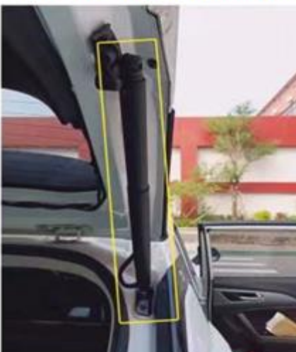
Установите правый электропривод задней двери