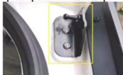
Замените правый кронштейн на кузове