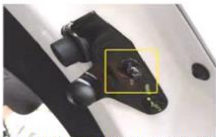
Замените болт с шаровой головкой на левом кронштейне задней двери