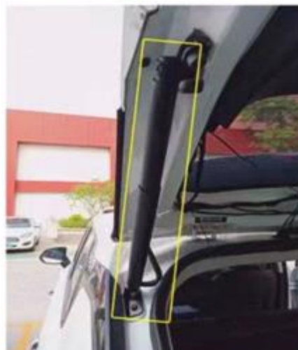
Установите левый электропривод задней двери