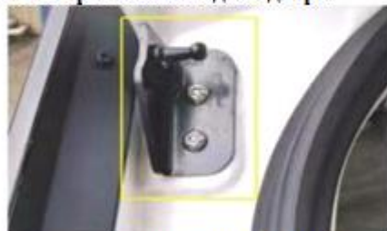
Замените левый кронштейн на кузове