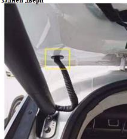
Проложите жгут левого электропривода