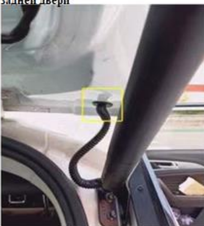
Проложите жгут правого электропривода